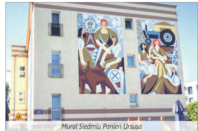
Mural Siedmiu Panien Ursusa