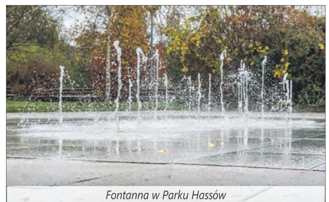
Fontanna w Parku Hassów

Wzdłuż ul. Zagłoby został zmodernizowany pasaż spacerowy. Jego przestrzeń ujednolicono przez zastosowanie tego samego typu ławek i koszy na śmieci na całym terenie. Dosadzono drzewa i krzewy. Na terenie siłowni