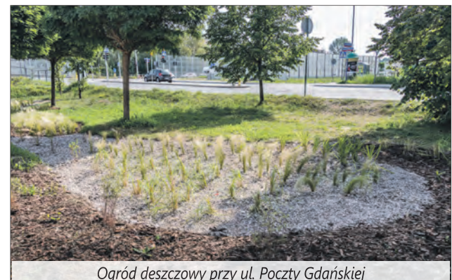
Ogród deszczowy przy ul. Poczty Gdańskiej