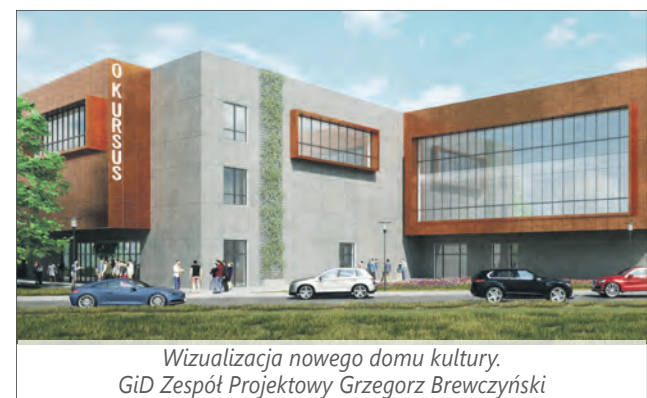
Wizualizacja nowego domu kultury, GiD Zespół Projektowy Grzegorz Brewczyński

Trwają prace projektowe nowego domu kultury, który zastąpi obecną siedzibę Osrodka Kultury „Arsus” przy ul. Traktorzystów 14. Będzie to nowoczesny i funkcjonalny obiekt zaprojektowany do prowadzenia różnych form działalności kulturalnej, spełniający ekologiczne standardy. Nowy osrodek kultury powstanie przy ul. Kazimierza Gierdziejewskiego. Trzykondygnacyjny budynek będzie zbudowany na planie litery „L” wyciszonym przez układ dwóch największych pomieszczeń: sali widowiskowej mieszczącej 500 osób i sali kinowej dla 144 osób. Na poszczególnych piętrach znajdują się sale do różnego rodzaju aktywności artystycznych. Będzie również profesjonalne studio nagrań. W budynku wykorzystane zostaną odnawialne źródła energii. Panele fotowoltaiczne, pompy ciepła, zbiorniki na wodę opadową i system odzysku tzw. wody szarej pozwolą na znaczne oszczędności w kosztach utrzymania obiektu. Nowy osrodek kultury jest zaprojektowany bez barier architektonicznych. Posiada rozwiązania, które umożliwią osobom niepełnosprawnym włączenie się we wszystkie rodzaje aktywności. Dzięki temu stanie się on przyjaznym, wygodnym, a przede wszystkim bezpiecznym miejscem integracji mieszkańców naszej dzielnicy.