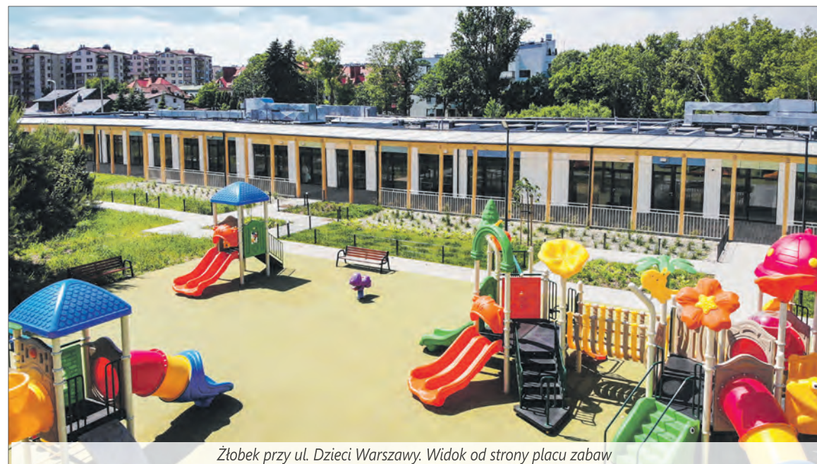
Żłobek przy ul. Dzieci Warszawy. Widok od strony placu zabaw

BOGDAN OLESIŃSKI Burmistrz Dzielnicy Ursus m.st. Warszawy