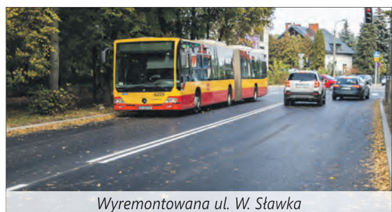
Wyremontowana ul. W. Sławka