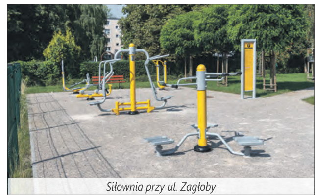
Siłownia przy ul. Zagłoby

plenerowej zainstalowano nowe urządzenia. Inwestycja zrealizowana w ramach budżetu obywatelskiego. Koszt: 289,9 tys. zł.