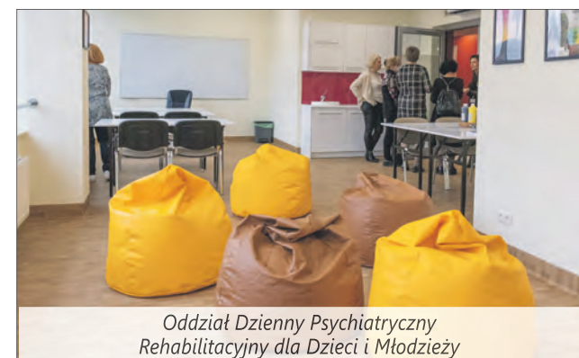
Oddział Dzienny Psychiatryczny Rehabilitacyjny dla Dzieci i Młodzieży

Na potrzeby placówki zmodernizowano pomieszczenia w części budynku przy pl. Czerwca 1976 r. nr 1 nieodpłatnie udostępnione przez urząd dzielnicy. Placówka służy dzieciom i młodzieży cierpiącym na schizofrenię i zaburzenia psychiczne. Prowadzi też konsultacje i zajęcia dla rodzin osób chorych. Oprócz gabinetów specjalizacyjnych będzie również funkcjonować przyszpitalna szkoła dla pacjentów klas 6–8 szkoły podstawowej. Koszt inwestycji: 2,6 mln zł, w tym 2 mln zł finansowane z budżetu miasta.