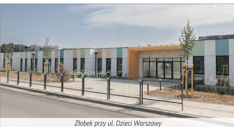
Żłobek przy ul. Dzieci Warszawy