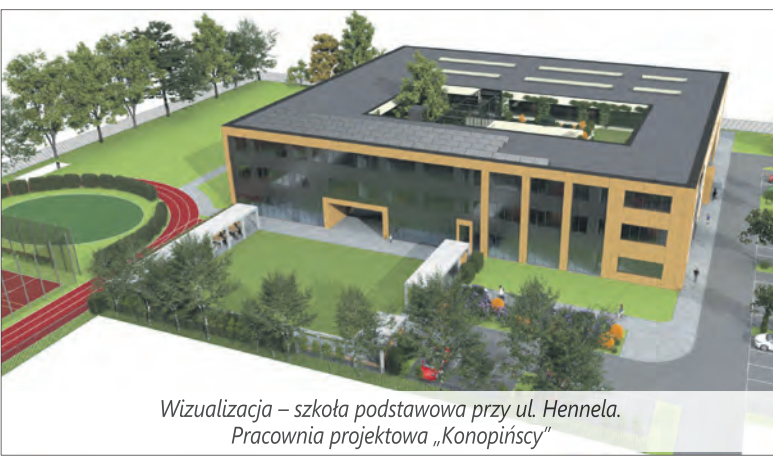
Wizualizacja – szkoła podstawowa przy ul. Hennela. Pracownia projektowa „Konopiński”